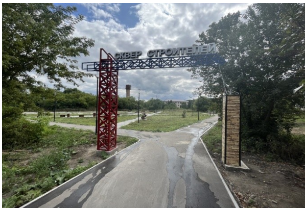
Сквер Строителей (3 этап):